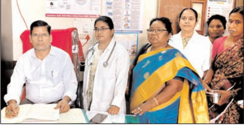
కఠిన చర్యలుసిబ్బంది సమయపాలన పాటించకపోవడంపై ఆయన ఆగ్రహం వ్యక్తం చేశారు. ఉదయం 9 గంటల నుండి సాయంత్రం 4 గంటల వరకు ప్రతి ఒక్కరూ విధుల్లో అందుబాటులో ఉండాలని స్పష్టం చేశారు. ముందస్తు అనుమతి లేకుండా విధులకు హాజరుకాని ఒడ్డుగూడెం ఆరోగ్య ఉపకేంద్ర సిబ్బందికి తక్షణమే వివరణ కోరుతూ నోటీసులు జారీ చేశారు.